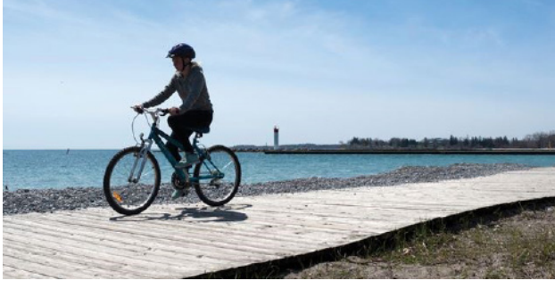
惠特比自行车环行 周五, 十月十二号 下午 3:30—6 点