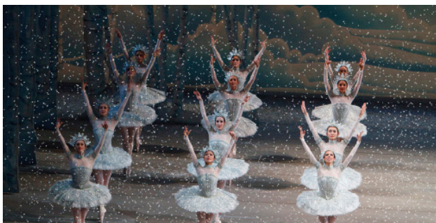
胡桃夹子 多伦多国家芭蕾舞剧院 周六，十二月八号 大约费用: $120