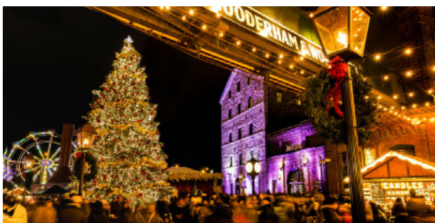
圣诞古酿酒厂区 多伦多 周六，十二月十五号