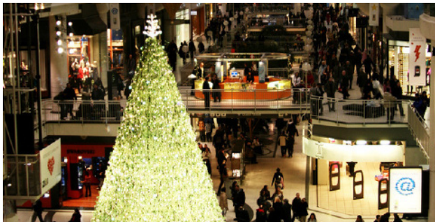
圣诞节购物-多伦多约克岱尔购物中心 周六，十一月二十三号