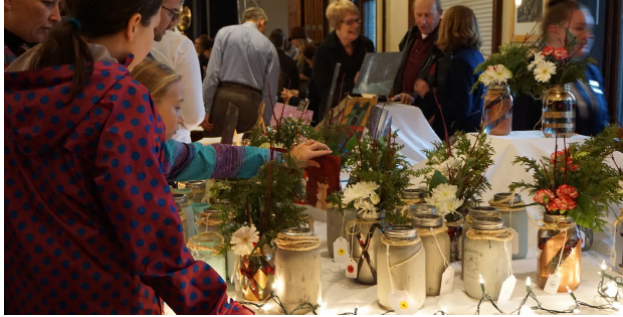
城堡义卖活动 周六，十一月十七号 特拉法城堡活动—全校参加