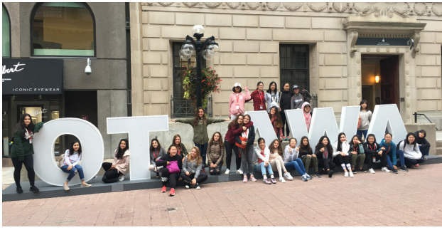
渥太华旅行 感恩节长周末 十月五号—八号 大约费用: $900