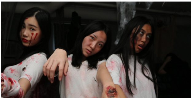
城堡冒险 周五, 十月二十六号 万圣节特拉法城堡活动