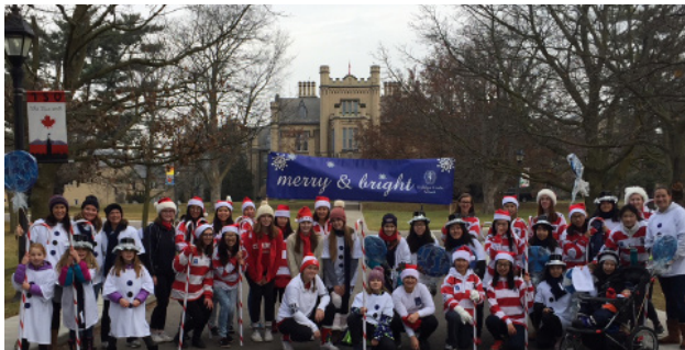
惠特比圣诞游行 周六，十二月一号