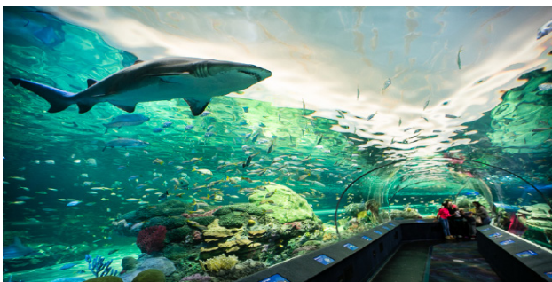
多伦多雷普利水族馆 周六, 十一月三号 大约费用: $50