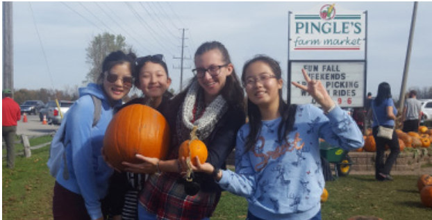
平乐农场集市 周六, 十月二十号