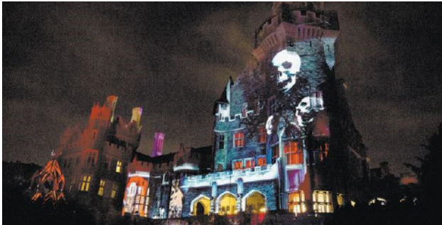
多伦多卡萨罗马“恐怖传奇” 周六, 十月十三号 晚上六点—十点 大约费用: $70