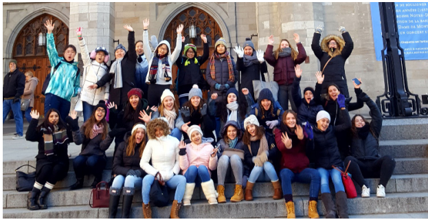
蒙特利尔旅行 中期长周末 十一月九号—十二号 大约费用：$900